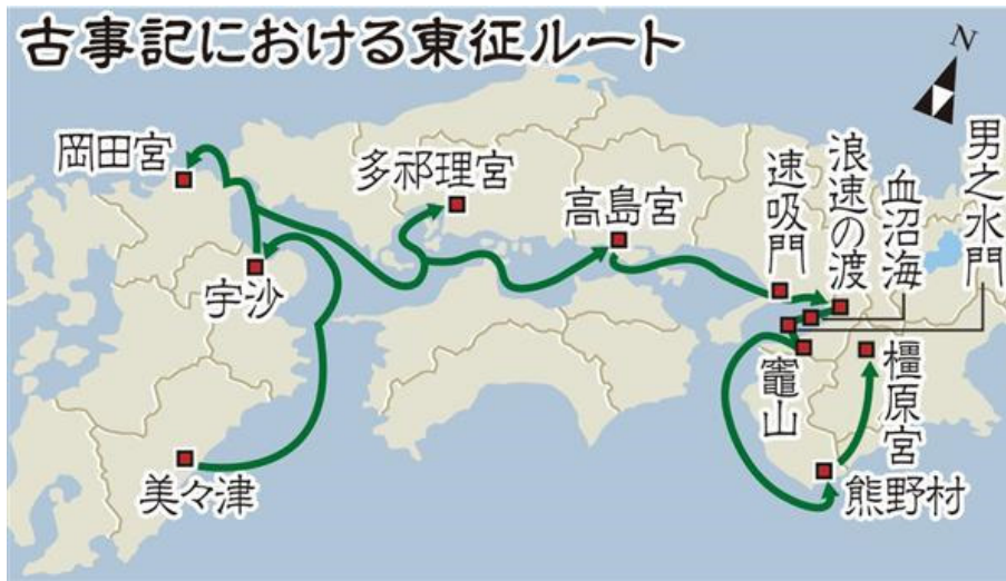
شکل ۱- مسیر سفر دریائی امپراتور "جین مو تین نو" به روایت <کوچی کی>.

در کتاب <کوچی کی> ۱ آمده است که اولین امپراتور ژاپن "جین مو تین نو" ۲ در یازده فوریه سال ۶۶۰ پیش از میلاد تاج گذاری کرد و این روز را به تاریخ تاسیس ژاپن منتسب کرده است. روایت است که "جین مو تین نو" در استان میازاکی در جزیره کیوشو متولد شده است. او در سن ۴۵ سالگی به همراه یارانش با کشتی پس از یک سفر (بسوی خاور) طولانی چند ماهه وارد جزیره هونشو می شود و در معبد شینتوی <کاشی هارا> ۳ در استان نارا تاج گذاری می کند. از آن پس است که سنت حکومت امپراتوری در ژاپن همچنان تا به امروز ادامه پیدا می کند.