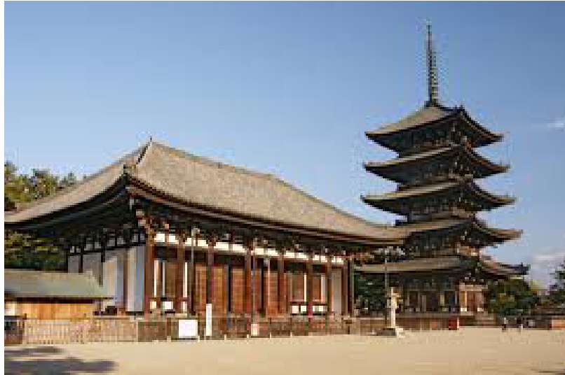
فرتور 4 معبد "کوفوکوجی" در شهر نارا.

معبد کوفوکوجی یکی از معابد قدیمی در ژاپن است و تاسیس آن را به سال 710 میلادی ذکر کرده اند. اوایل قرن هشتم میلادی درست مصادف با معرفی و ورود آئین بودیسم در ژاپن است. این معبد اشاعه دهنده یکی از اولین و قدیمی ترین شاخه های آئین بودیسم به نام "هوسوشو" 9 می باشد. "آشورا" نماد و منادی آموزه های این شاخه بودیسم بشمار می آید. بودیسم "هوسوشو" تمام واقعیت هستی را وابسته به "تنها خودآگاهی" می کند. تنها "خودآگاهی" انسان است که تعیین کننده زندگانی زمینی است. البته خودآگاهی انسان سطوحی دارد و هر سطحی کارکردی. (تشریح مفصل آموزه های این شاخه بودیسم که البته شالوده های آئین بودیسم را ترسیم می کند از حوصله این نوشتار کوتاه خارج است). آشورا از سه چهره جوان و شش دست برخوردارست (فرتور 5).