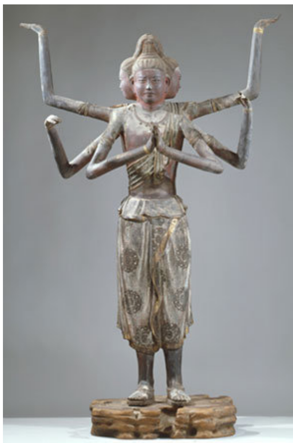
فرتور 3 تندیس "آشورا" در معبد "کوفوکوجی".

سه سطح اخلاقی جهنمی، حیوانی وحشی و اشباع گرسنه قابل تعالی نیستند اما سطوح دیگر، آسوراها، انسان و آسمانی از استعداد متعالی شدن برخوردار هستند. اهورامزدا که از آسمان به بیرون پرتاب می شود و در گروه آسوراها افت مقام پیدا می کند، اما هنوز از استعداد اصلاح اخلاق خود برخوردار است. روایت است که او جذب آموزه های بودا می شود. در تمام جلسات و عظ بودا شرکت می کند و با شوق وافر فراگیرنده درس های فرا زمینی و عرفانی بودا می شود. با تمام خدایان اهریمنی ترک مودت می کند و از قهر و خشونت دوری می جوید. این بار به عنوان مرید و مبلغ پرآوازه آموزه های بودا در آئین بودیسم جایگاهی پسندیده و بسنده بدست می آورد. برای اولین بار تندیس مقدس اهورا مزدا در بودیسم ژاپن به نام آشورا 7 در معبد "کوفوکوجی" 8 در شهر نارا جلوس می کند. فرتور 3 تندیس "آشورا" و فرتور 4 معبد "کوفوکوجی" را نشان می دهد.