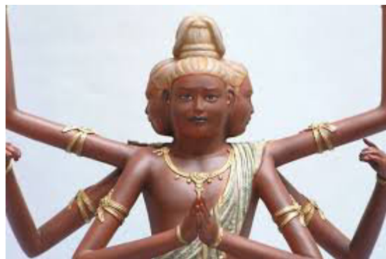
فرتور 5 آشورا با سه چهره و شش دست.

معبد کوفوکوجی یکی از معابد قدیمی در ژاپن است و تاسیس آن را به سال 710 میلادی ذکر کرده اند. اوایل قرن هشتم میلادی درست مصادف با معرفی و ورود آئین بودیسم در ژاپن است. این معبد اشاعه دهنده یکی از اولین و قدیمی ترین شاخه های آئین بودیسم به نام "هوسوشو" 9 می باشد. "آشورا" نماد و منادی آموزه های این شاخه بودیسم بشمار می آید. بودیسم "هوسوشو" تمام واقعیت هستی را وابسته به "تنها خودآگاهی" می کند. تنها "خودآگاهی" انسان است که تعیین کننده زندگانی زمینی است. البته خودآگاهی انسان سطوحی دارد و هر سطحی کارکردی. (تشریح مفصل آموزه های این شاخه بودیسم که البته شالوده های آئین بودیسم را ترسیم می کند از حوصله این نوشتار کوتاه خارج است). آشورا از سه چهره جوان و شش دست برخوردارست (فرتور 5).