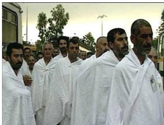
فرتور 1 راست: احرام، چپ: موبد زرتشتی در حال عبادت در مقابل آتش جاویدان

وقوف در عرفات - دومین عمل حج وقوف در عرفات است. دامنه ی کوه عرفات در 12 کیلومتری مسجد الاحرام قرار دارد و زائرین مجبور هستند تا ظهر روز نهم ذیحجه به عرفات برسند و تا مغرب همان روز که شب عید قربان است در آن جا توقف کنند (فرتور 2). در منابع سبب وقوف در عرفات بروشنی توضیح داده نشده است. ظاهراً خود عمل توقف در عرفات مراد است. به خود آمدن و گناهان خود را برانداز کردن و تمایل به توبه و احیاناً دعا خواندن (دعای اباعبدالحسین و امام زمان) می تواند مشغولیات لحظات وقوف در عرفات باشد.