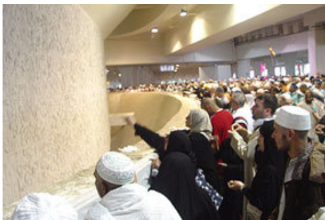
فرتور 3 رمی جمره در منا

در متون اسلامی حکایت می شود که ابراهیم زمانی که می خواسته است فرزند خود اسماعیل را در برابر خدا قربانی کند شیطان بارها مانع او می شده است، ولی هر بار ابراهیم برای انجام وظیفه خود با سنگی که به شیطان پرتاب می کرده است مانع از مزاحمت آن شده است. عمل سنگ اندازی به ستون نماد شیطان در سنت حج یادگار عمل شجاعانه ی ابراهیم شمرده می شود.