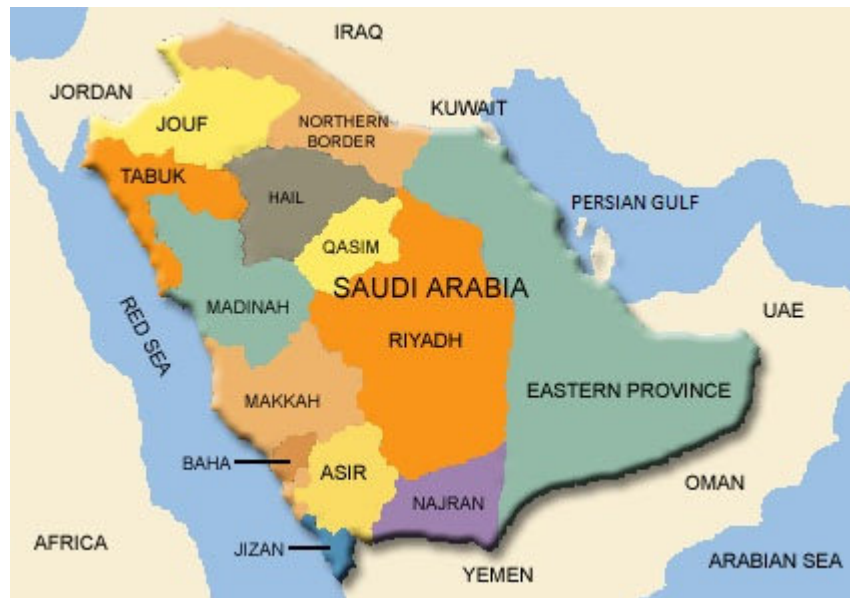
فرتور 1 نقشه عربستان سعودی

لازم می دانم پیش از معرفی مقاله ی استاد به شرح مختصری از اعمال سنتی حج در مکه به پردازم به امید این که پیش زمینه ای مناسب برای درک بهتر نظریه ی او برای خواننده بشود. اعمال حج در شهر مکه برگزار می شود. حج به معنای قصد و عزم برای حرکت بسوی مقصود که همانا مکه است. شهر مکه یکی از شهرهای منطقه حجاز است که در کناره ی جنوب شرقی دریای سرخ قرار گرفته است (فرتور 1). منطقه حجاز از عصر باستان سرزمین خشک و بی آبی بوده است که کوه های بسیار نیز در آن مشاهده می شود. از دوران باستان منبع آب این منطقه از راه حفر چاه ها تامین می شده است. در مکه هم چاه های زیادی وجود دارد و چاه زمزم که در مسجداالحرام در جوار کعبه قرار دارد یکی از چاه های معروف این شهر شمرده می شود.