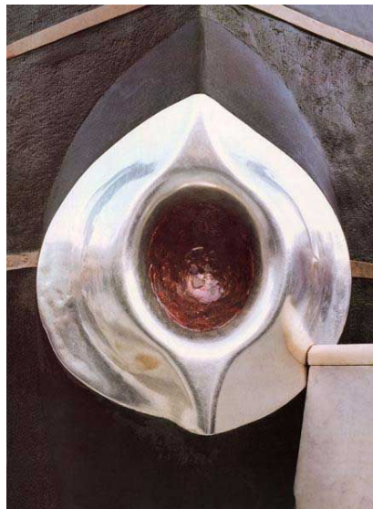
فرتور 5 حجرالاسود یا سنگ سیاه در گوشه ی کعبه