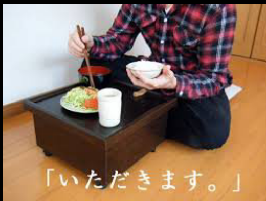
箱膳 = hako-zen

تا قبل از عصر می جی که ژاپن با دنیای مدرن در تماس می شود آن ها روی میزهای کوچک و کوتاه یک نفره (هاکوزن) غذا می خوردند. از آن جایی که فاصله دهان تا میز زیاد است و احتمال ریزش خوراک مخصوصا سوپ وجود دارد آن ها مجبور بودند ظرف را تا دهان خود بلند کنند. این عادت غذا خوری مودبانه تعبیر می شد چون سبب عدم ریزش غذا می شد. این عادت همچنان بین مردم پایدار مانده است.