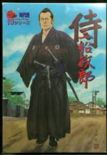
侍 = Samurai

سامورائی ها شمشیر خود را ابتداء طرف چپ کمر می بستند ولی در سمت راست خیابان تردد می کردند. اما پی بردند زمانی که در خیابان راه می روند امکان دارد به کسی برخورد کنند و احيانا سبب درگیری شوند. بنابراین سعی کردند از طرف سمت چپ حرکت کنند تا با کسی برخورد نکنند. این سنت از طرف چپ حرکت کردن در رانندگی هم زنده شده است. البته تاثیر فرهنگ رانندگی انگلستان در ژاپن را نباید انکار کرد.