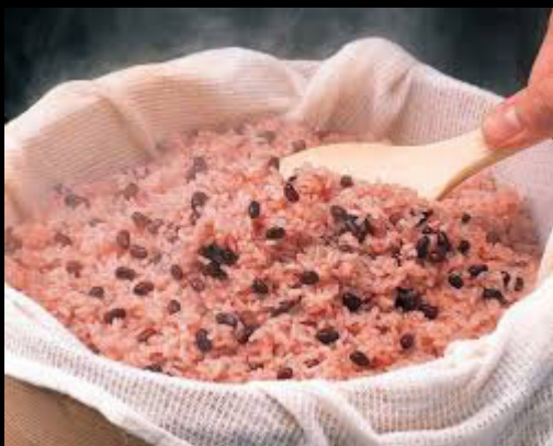
赤飯 = seki-han

تهیه پلوی قرمز یا "سه کی هان" در جشن و مناسبت های شادی آفرین صیانت از این سنت و گرامیداشت آن است.