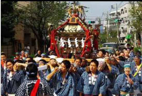
神輿 = Mikoshi = portable shrine

حرکت “می کوشی” به این جهت صورت می گیرد تا “خدا” ی ساکن و ساکت را نسبت به آرزوهای خودشان با خبر کنند و با تحریک، او را نیرومندتر در امر یاری رسانی به کسب و کار آن ها بسازند.