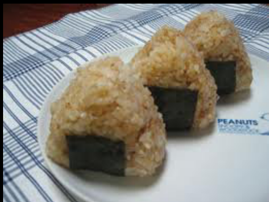
おむすび = o-musubi

امروزه شکل "اُموسوبی" بیشتر مثلث مانند است که تداعی گر شکل قلب بوده تا احساس قدردانی در آن نیز بیان شود.