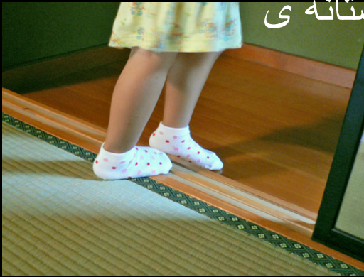
敷居 = shiki-i

2- دشمنان در قدیم زیر کف اتاق ها کمین می کردند و بیشتر از آستانه ی اتاق یا لبه تاتامی به افراد داخل خانه با شمشیر حمله می کردند. از راه نوری که از شکاف لبه ی تاتامی یا آستانه ی اتاق به بیرون نفوذ می کرد موقعیت افراد درون خانه قابل تشخیص می شد.