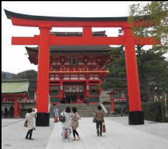
鳥居 = Tori-i

توری ای نماد معابد آئین باستانی شینتو است و همیشه جلوی رهگذر ورودی معبد تعبیه شده است. پیروان این آئین باور دارند که خدایان بر روی توری ای نزول می کنند تا در معبد ساکن شوند. رنگ سرخ وجود توری ای را چشمگیرتر می کند و برای راهنمایی بهتر خدایان تلقی می شود. ضمناً رنگ سرخ تقدس خورشید و آتش را تداعی می کند.